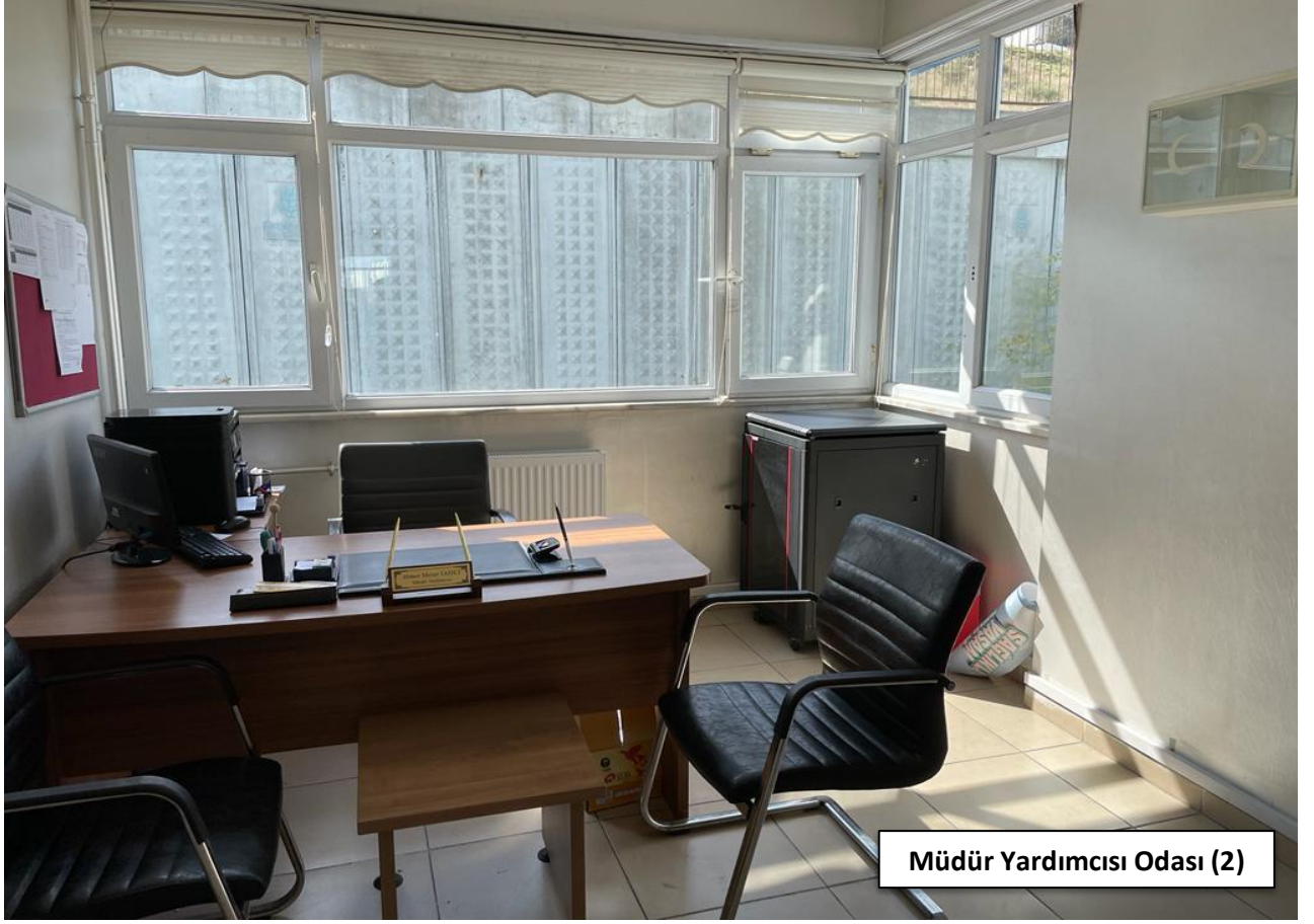
Müdür Yardımcısı Odası (2)