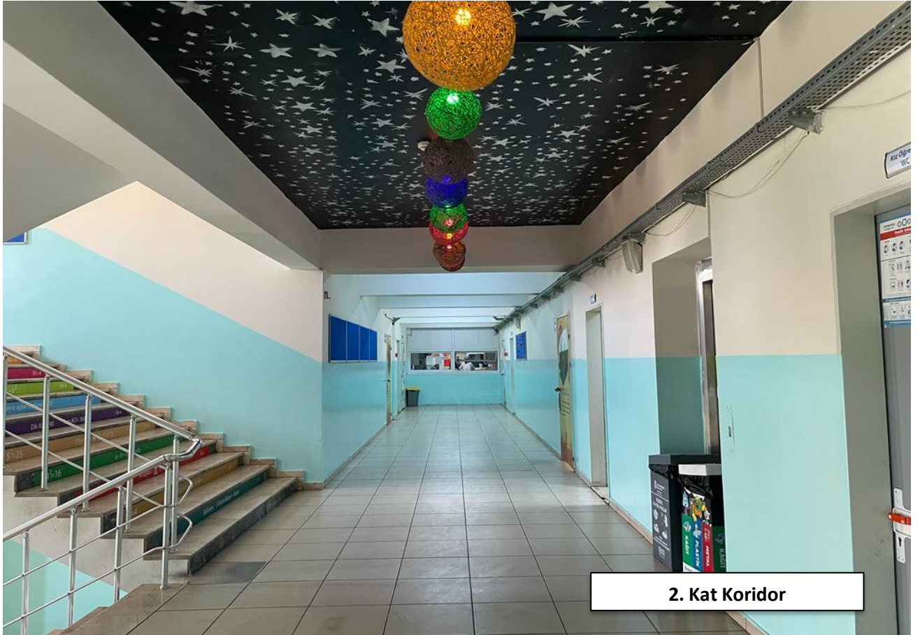
2. Kat Koridor