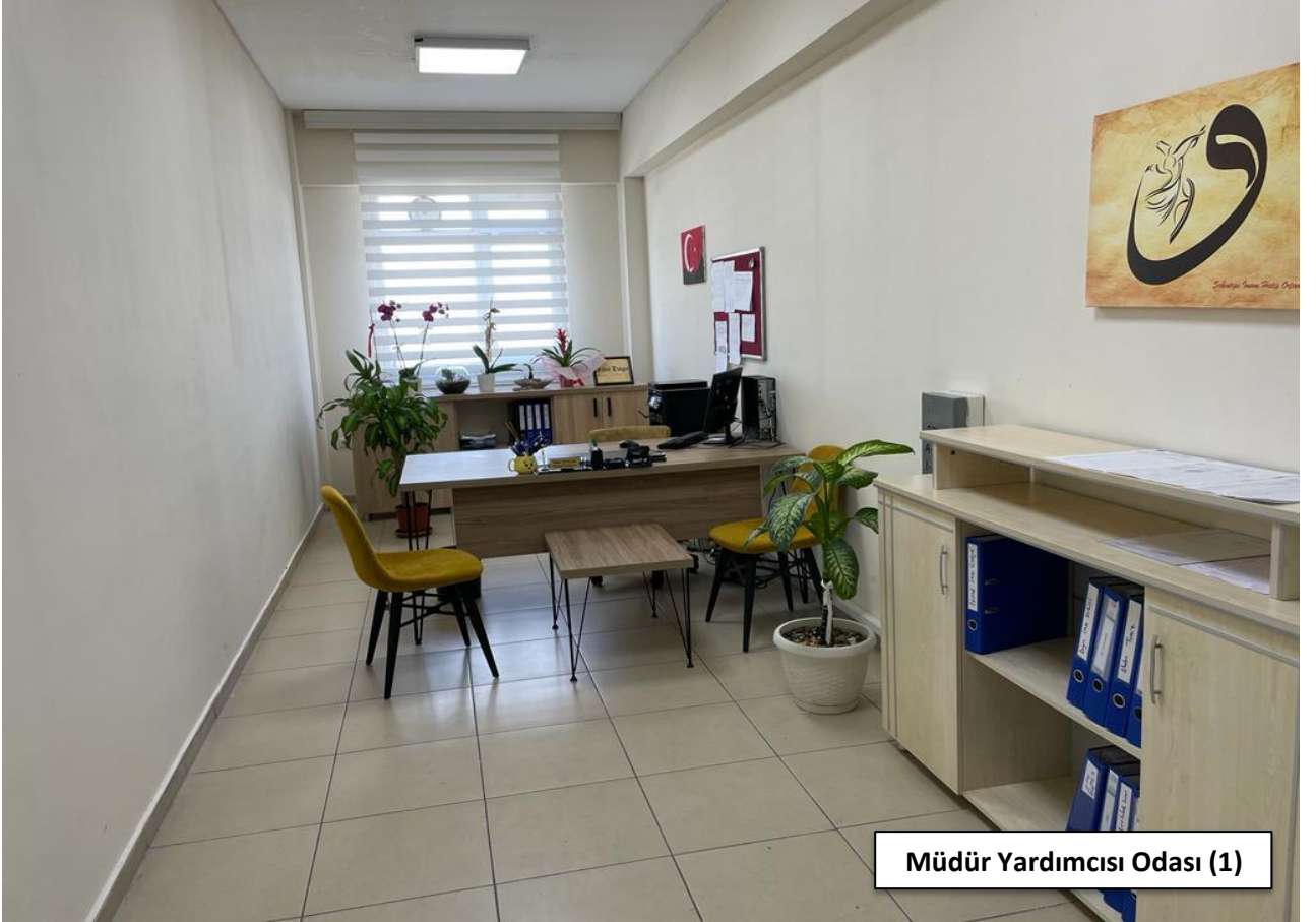
Müdür Yardımcısı Odası (1)